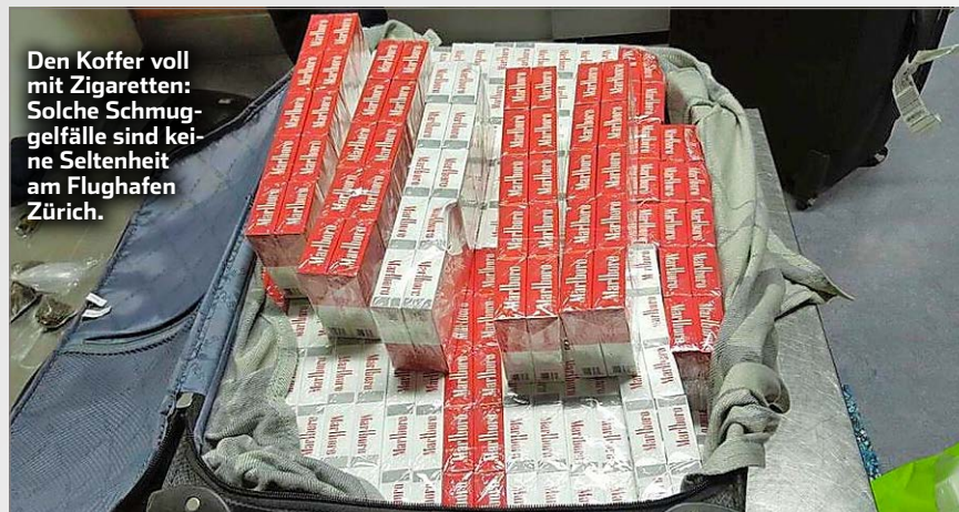
Den Koffer voll mit Zigaretten: Solche Schmuggelfälle sind keine Seltenheit am Flughafen Zürich.

Es ist Hauptreisezeit am Flughafen Zürich. Und wo geflogen wird, wird geschmuggelt. Besonders beliebt: Zigaretten. SonntagsBlick liegen die Halbjahreszahlen des grössten Schweizer Flughafens vor. Laut Karl Fässler (59), Leiter Passagierdienst am Flughafen-Zoll, wurden bis Ende Juni 742 Fälle von Zigaretten-schmuggel registriert. Das ist nicht ganz die Hälfte der total 1529 Fälle, die im Gesamtjahr 2015 aufgegriffen wurden. Aber die schmuggelintensive Feriensaison hat erst begonnen.